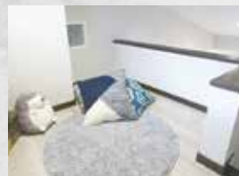
SKY LOFT スカイロフト