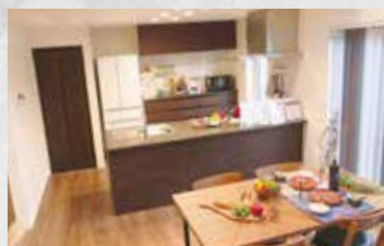
SKIP FLOOR KITCHEN スキップフロアダイニングキッチン