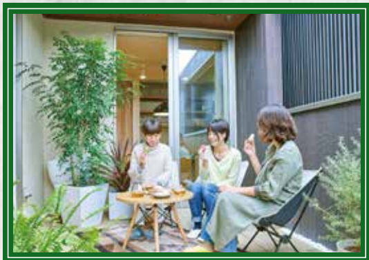
CAFE TERRACE カフェテラス