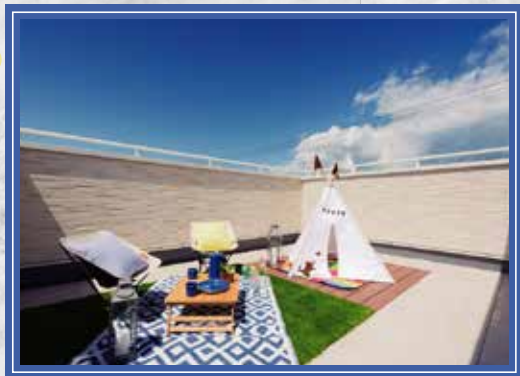
SKY GARDEN スカイガーデン