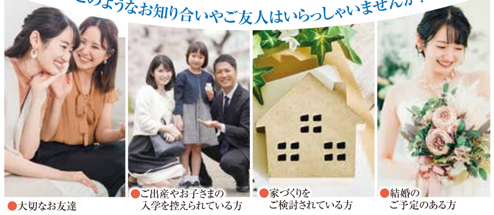
●大切なお友達 ●ご出産やお子さまの入学を控えられている方 ●家づくりをご検討されている方 ●結婚のご予定のある方