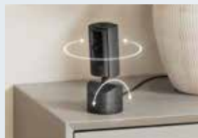
首振り機能付き屋内カメラ