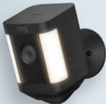
Spotlight Cam Plus Battery Black