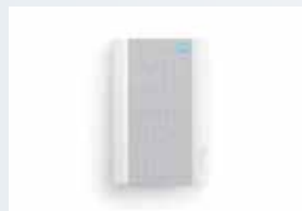
中継器機能付きチャイム