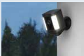
センサーライト付き屋外カメラ