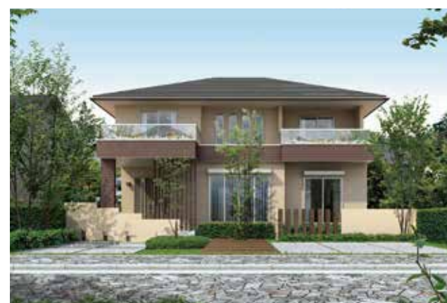
トラディショナル style