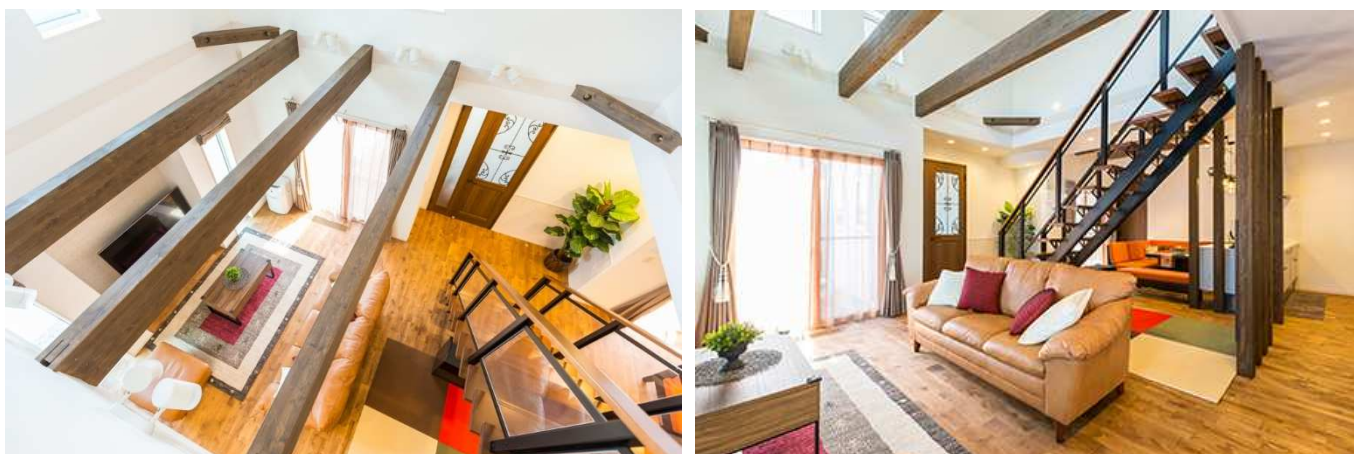
（YUCACO システム導入事例、全て当社施工例）

従来の全館空調システムに比べ導入時のインシタルコストも大幅に抑えられるこのシステムは、ハウス・オブ・ザ・イヤー・イン・エナジー大賞を受賞した高気密・高断熱の技術力を生かした新商品です。住み心地の改善、健康効果、低コスト・省エネ（光熱費）の面でより高い効果が得られます。