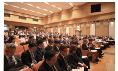
セミナー会場の様子

主催:こうべKANSAI 住環境議会 後援:兵庫県/神戸市/神戸新聞社/サンテレビ